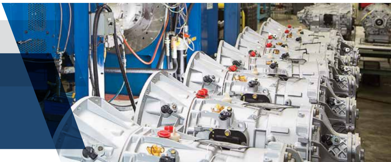
Depuis la création du programme ReTran, près de 450 000 transmissions Allison ReTran ont été renouvelées.